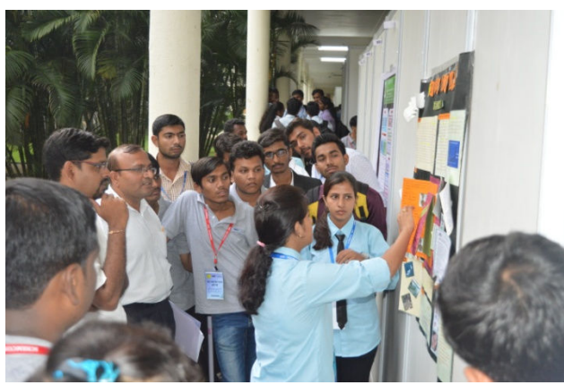
Technical quiz was organized for participants and more than 200 students taken part in it. 03 groups were awarded prizes and certificate of merit.